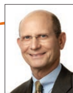
Ted Wilson je predsednik Crkve adventista sedmog dana