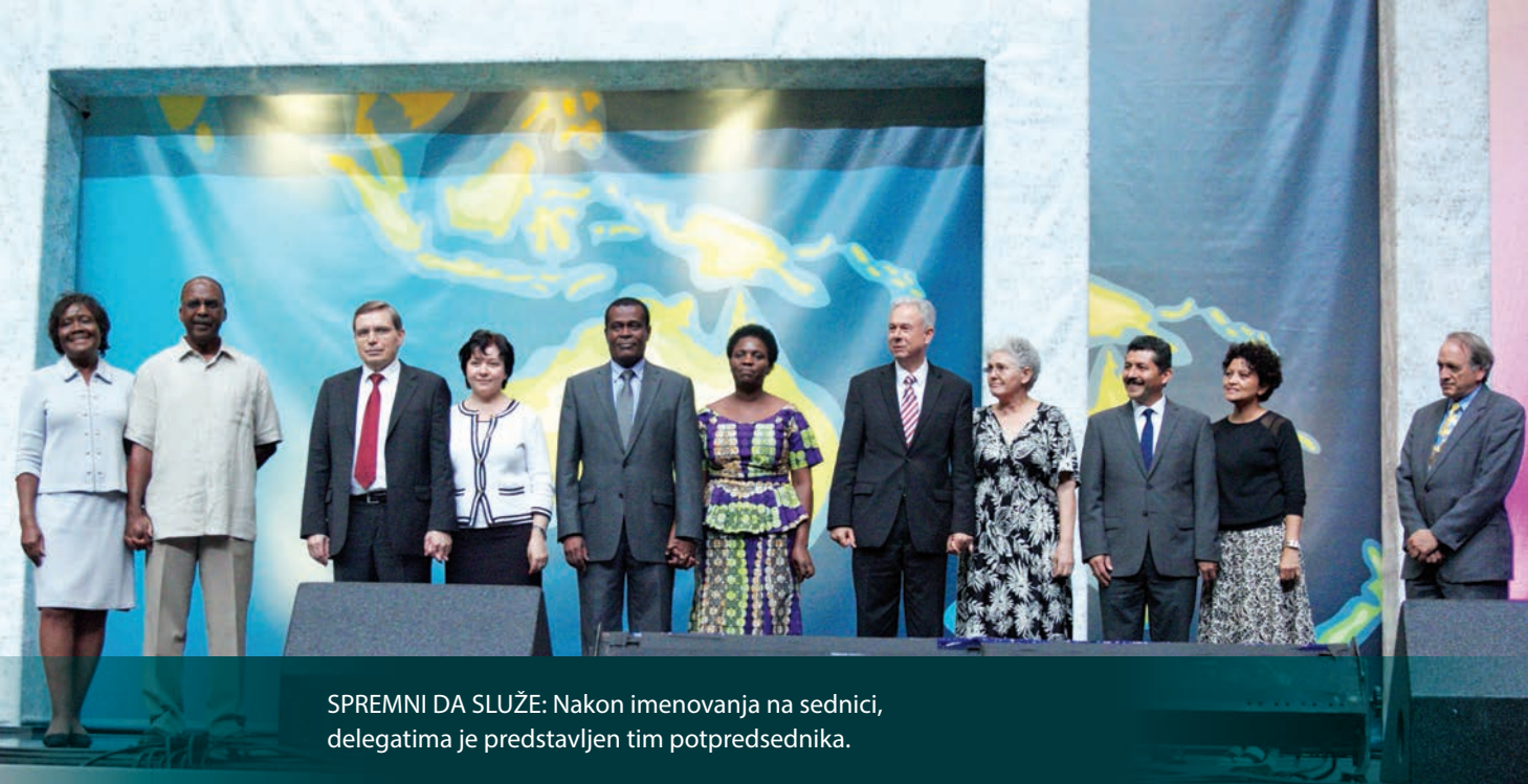
SPREMNI DA SLUŽE: Nakon imenovanja na sednici, delegatima je predstavljen tim potpredsednika.