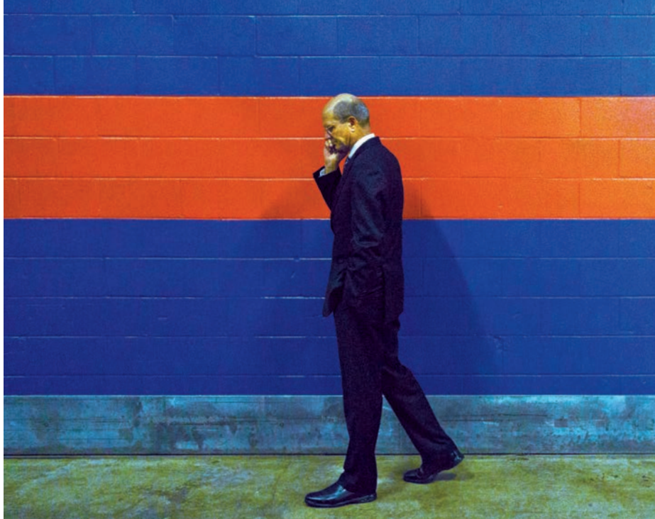
JOŠ PET GODINA: Predsednik Generalne konferencije, Ted N. K. Wilson, vođa crkve i u sledećih pet godina.

Stoga pozivam sve one koji su razočarani, čak i one koji se osećaju utučeni, da sagledaju mnogo širu sliku. Crkva adventista sedmog dana proći će uspešno kroz mnogo šta, ali ne jednostavno kao ljudska organizacija. To je pokret, pokret sa biblijskom vešću. Takvo shvatanje pomaže svima nama da pronađemo stabilnost u sopstvenom životu i u misiji crkve. Biće trenutaka kada se nećete slagati sa nekom odlukom duže vremena, ali