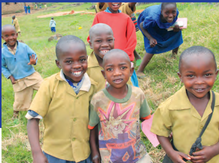
LICE SUTRAŠNJICE: Deca u adventističkoj školi u Ruhengeri mogu da se raduju svetloj budućnosti u obnovljenoj zemlji.

ne ambasadama, i samo posmatrao grad Kigali. Ovo će biti nova zgrada crkvene administracije u Ruandi, sa mnogo kancelarija koje će se izdavati i tako pribavljati sredstva za nove projekte: škole koje će puniti univerzitet, klinike koje će se brinuti o zdravlju stanovnika, crkve.