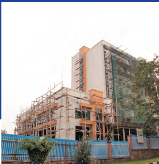
SEDIŠTE NOVE RUANDSKE MISIJE: U izgradnji u Kigaliju.