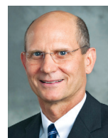
Ted N. Vilson predsednik Hrišćanske adventističke crkve.

Pozivam sve nas da se ujediniamo u uzdizanju Isusa i objavljivanju opravdanja verom: ujediniamo se u usmeravanju ljudi na silnu Božju reč; ujediniamo se u biblijskim istinama; ujediniamo se u čitanju Duha proroštva; ujediniamo se u iskrenoj molitvi; ujediniamo se u širenju vesti o svetinj; ujediniamo se u objavljivanju