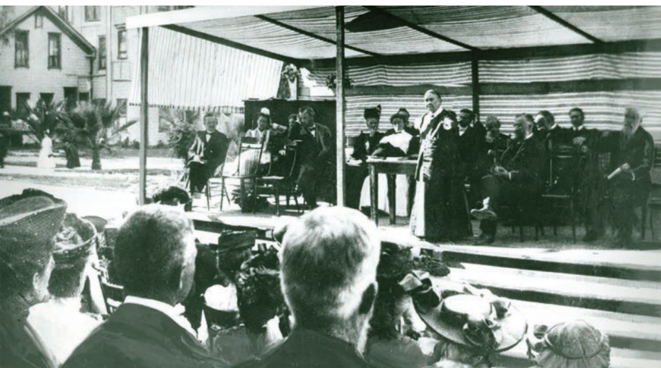
CENTRALNA BINA: Elen Vajt se obraća mnoštvu okupljenom u Loma Lindi 1906. godine.

A. F. Belindžera u vezi sa Hristovom službom u svetinji, a potom u vidu ostrašćene debate među istaknutim crkvenim vođama u pogledu značenja izraza koji se prevodi kao „svagdašnja žrtva“ u Danilu 8, 11. 12. 11