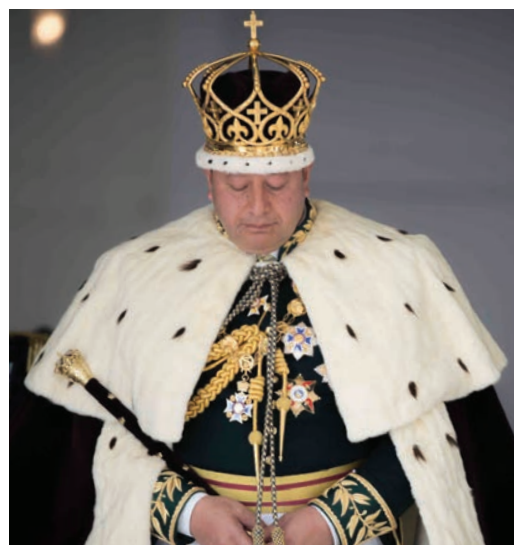
Kralj Tupua VI napušta crkvu nakon svog krunisanja u Nuku'alofa, u Tongi.

„Kralj, inače posebno zainteresovan za zdravlje, bio je veoma zadovoljan tim programom koji promovise vežbanje i zdrav izbor namirnica, što će ubuduće biti obezbeđeno za narod Tonge“, izveštava južnopacifički časopis Adventist Record .